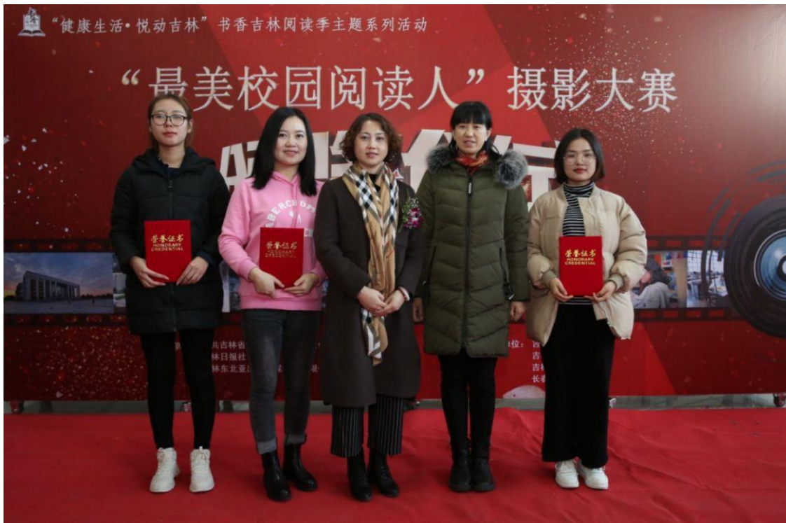
“最美校园阅读人” 摄影大赛