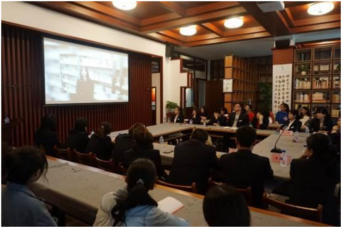
为书代言活动分享会