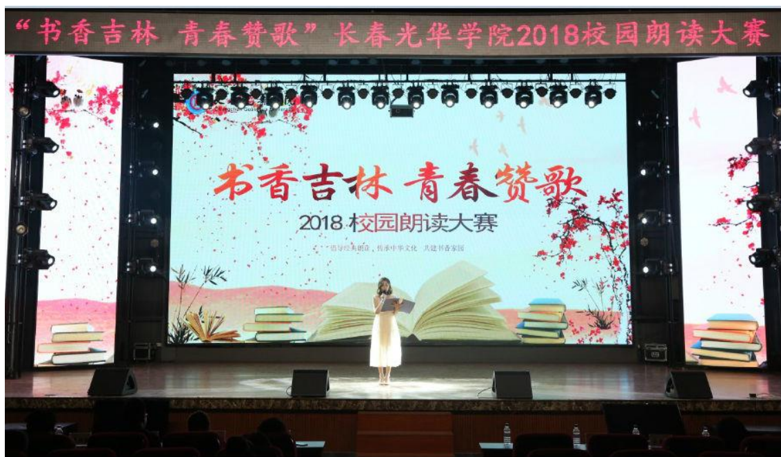
“书香吉林·青春赞歌” 校园朗读大赛