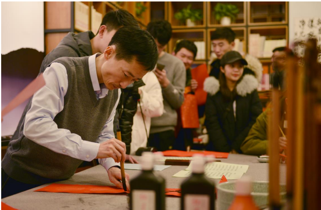
“迎新春，送福联”戊戌新春书法笔会