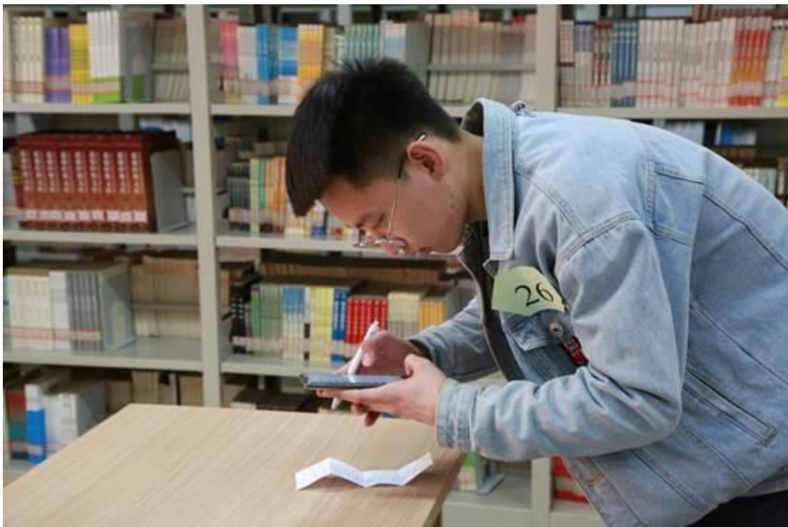
书库非常体验活动