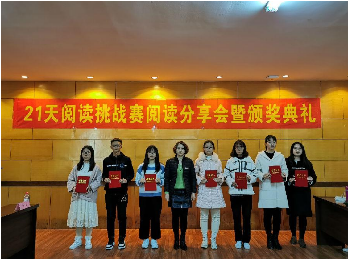
21 天阅读挑战赛活动