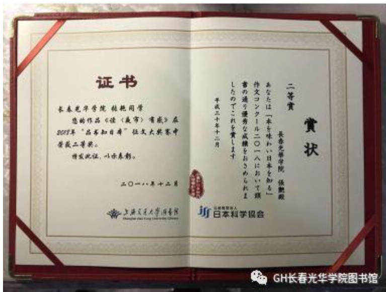
“品书知日本”获奖证书