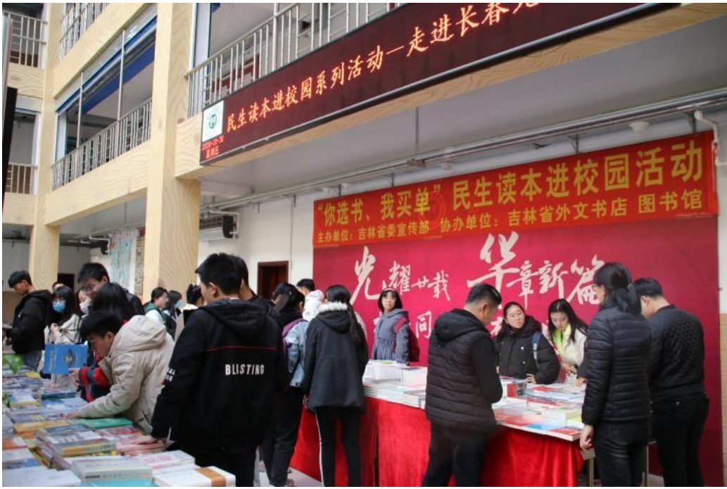
民生读本进校园赠书活动